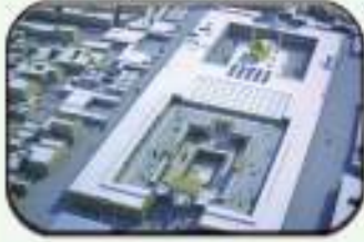
تصميم د. رؤوف الأنصاري