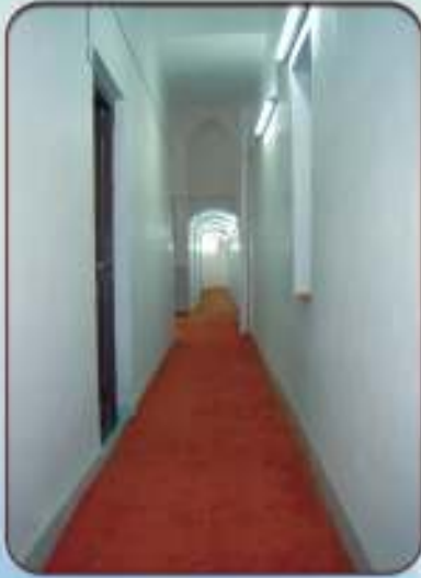
إعمار العنابق العلوي