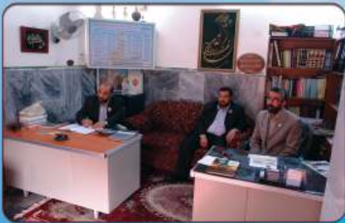
لقاء مع رئيس قسم الشؤون الدينية