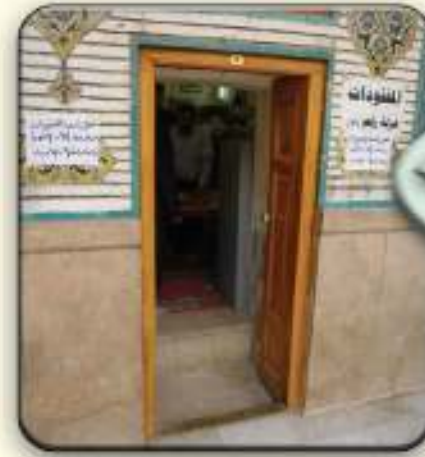
وحدة المفقودات غرفة رقم ٧

فالأعيان تسلم إلى شعبة المخازن وفق وصلات أصولية مع بيان وجهة