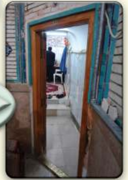
وحدة تقديم الهدايا للمتبرعين والمتبركين غرفة رقم ١١

الصرف. وبعد أن تصل إلى المخازن يكون التصرف بها وإخراجها وحسب ما طلبه المتبرع.