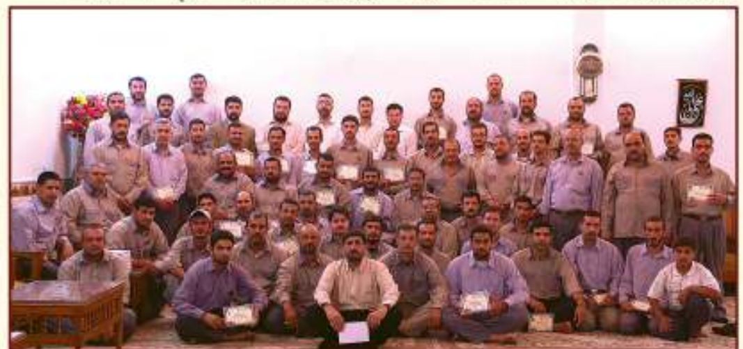
أقامة دورات دينية لخدم العتبة المقدسة ولأبنائهم