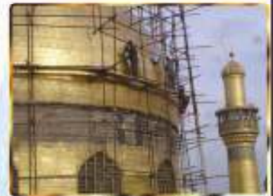
جلي القبة المطهرة