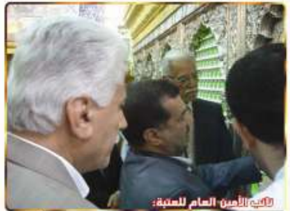
لأب الأمين العام للعتبة: بوضع آية استخراجه وقرآن آمون الضريح المطهر